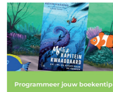
Programmeer jouw boekentip